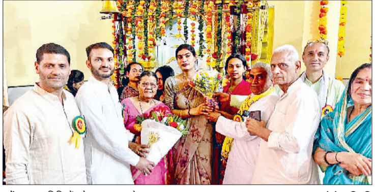
महेंद्रगढ़। अतिथियों को स्वागत करते हुए।