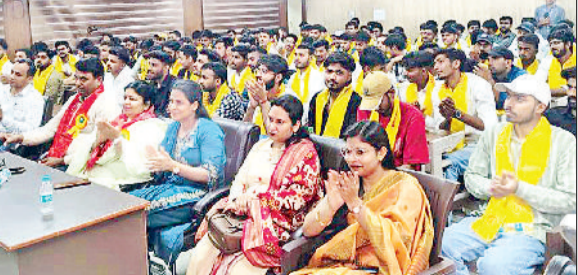
नारनौल। दीक्षांत समारोह में उपस्थित विद्यार्थी एवं स्टाफ।

आयोजन समिति के सभी सदस्यों के योगदान की सराहना करते हुए कार्यक्रम की सफलता के लिए आभार व्यक्त किया। इस अवसर पर कॉलेज के शिक्षक, कर्मचारी, एवम विद्यार्थी बड़ी संख्या में उपस्थित रहे, जिससे पूरा परिसर उत्सव एवं उल्लास के वातावरण में सराबोर नजर आया। प्रधानाचार्य ने बताया कि दीक्षांत समारोह न केवल विद्यार्थियों के लिए अविस्मरणीय क्षण बनकर उभरा, बल्कि संस्था की प्रतिष्ठा को भी नई ऊंचाइयों तक ले जाने वाला आयोजन साबित हुआ।