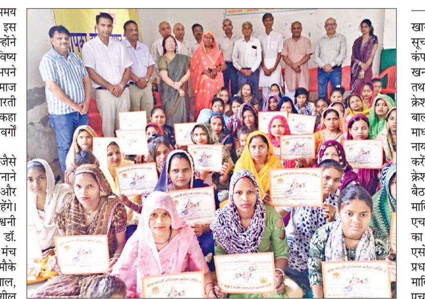
नारनौल। महिलाओं को प्रमाण पत्र वितरित करते हुए।