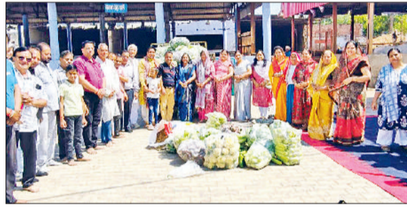
नारनौल। गोवंश के लिए स्वामणी लगाने आए संस्था के सदस्य।