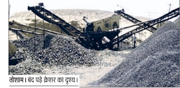
तोशाम। बंद पड़े क्रेशर का दृश्य।