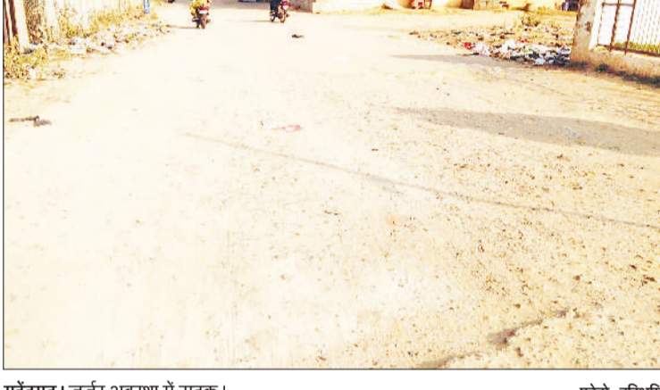
महेंद्रगढ़। जर्जर अवस्था में सड़क।

■ इस सड़क पर तीन हजार से अधिक लोग करते हैं आवागमन, स्टेट हाइवे जाने के लिए यह सबसे छोटा मार्ग